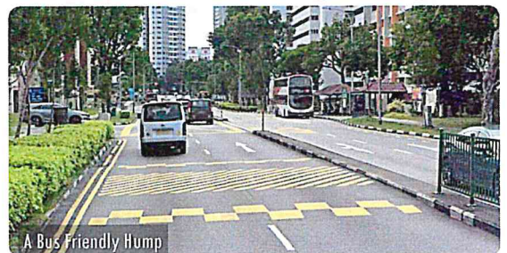
A Bus Friendly Hump

Make existing crossings safer by slowing down traffic in front of Grace Orchard School and pedestrian crossing in front of West Coast Market