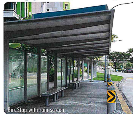
Bus Stop with rain screen

Existing bus stops at Blk 601 and West Coast Market and Hawker Centre will be upgraded to include more seats and rain screen